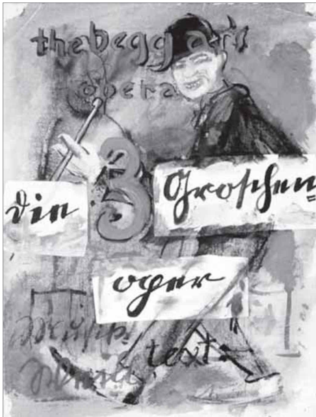
Stykket Laser og Pjalter hører til Bertolt Brechts mest kendte og mest opførte. Han har i sin tid selv skabt den frit efter John Gay's »Tiggeropera« fra det 18. århundrede. De to mestre Brecht og Shakespeare yndede begge at bruge andre forfattere som forlæg og gav dem gennem deres bearbejdning et personligt udtryk.

Ved det fredelige Skovbostrand ved Svendborg har