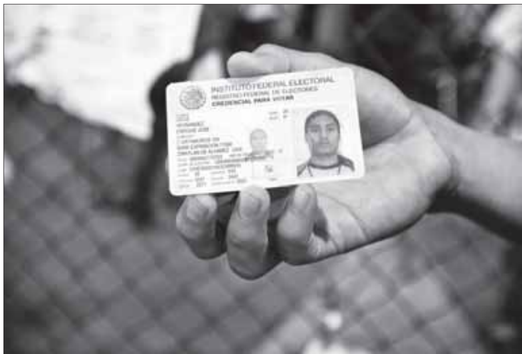
»En fyr viste mig sit valgkort og fortalte, at man havde nægtet at lade han stemme i Iztapalapa. Under en bro i bydelen Iztapalapa mødte vi mange mennesker, som ikke fik lov at stemme. Officielt fordi man var løbet tør for stemmesedler. Men vi så, hvordan der blev rettet i stemmesedler og en kvinde så, hvordan hendes »far« stemte, selvom han havde været død i tre år«, skriver fotografen Annick Donkers fra Mexico.