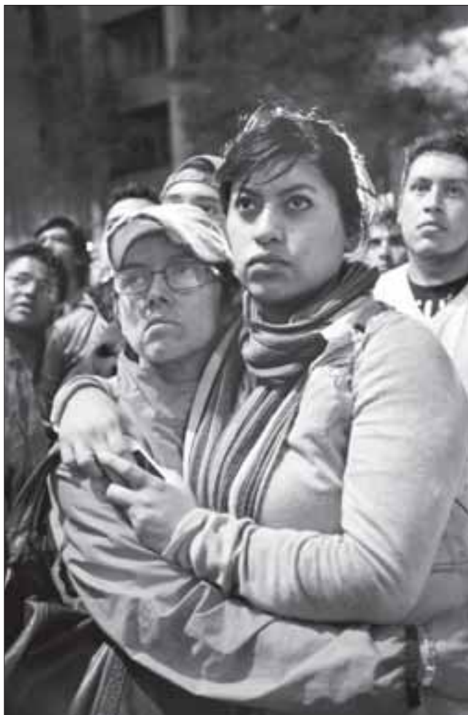
En af de hårde anklager om valgsvindel går ud på, at partiet PRI og kandidaten Enrique Peña Nieto anvendte millioner på at købe sig til massiv, positiv omtale på den store tv-station Televisa. Her fra en protest mod Televisa.