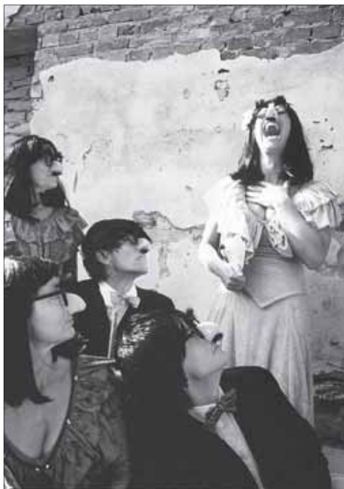
Fra forestillingen Ouverture. Den bliver vist hver dag klokken 17 til og med 17. august samt 20., 21. og 22. august på den asfalterede fodboldbane ved den bemandede legeplads i Stefansgade.