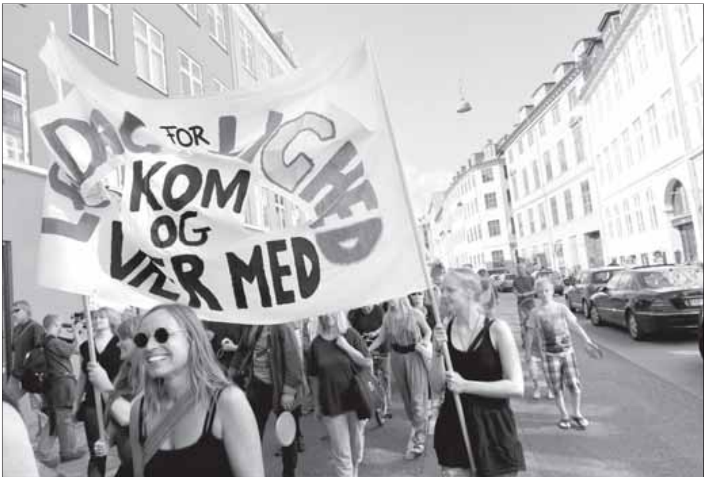
Under mottoet »Hit med pengene: Lad bankerne betale for krisen« gennemførte aktivistgruppen Lørdag for Lighed sin tredje lørdagsdemonstration fra Nytorv i København. Den næste aktion på lørdag kl. 15.00 har titlen »Proud'n Poor«.