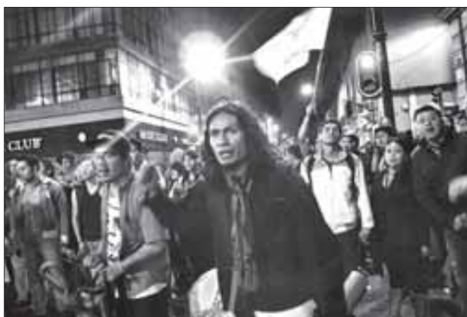
En af Mexicos aktive folkelige bevægelser for demokrati kalder sig »Yo soy #132«. Bevægelsen var aktiv i valgkampen og er nu blandt de, der afviser valgets resultat.