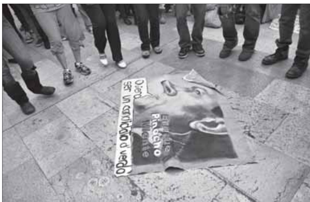
Pinocchio i valgkamp: »Jeg lover at være en ærlig præsidentkandidat«, lød det fra Enrique Peña Nieto fra partiet PRI. Men de mange eksempler på valgsvindel har fået mexicanske kunstnere til at gå med i protestbevægelsen, og med lette omskrivninger på spansk har man fået Enrique Peña Nieto til at fremtræde som »Løgnhalsen Enrique Pinocchio«. Her fra en aktion ved kunstmuseet i Mexico City.