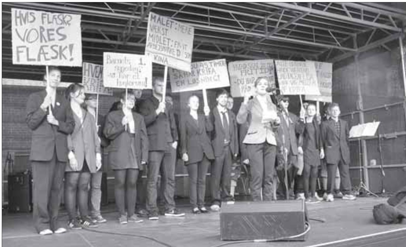
Unge fagligt bevidste aktivister bidrog ved den nylige store demonstration ved Restaurant Vejlegården til at slå fast, hvad Krifa i virkeligheden er, så færre forføres af al den tale om frihed. Det er en gul fagforening, som er kontrolleret af arbejdsgivere.

Forkortet. Læs hele indlægget på www.arbejderen.dk