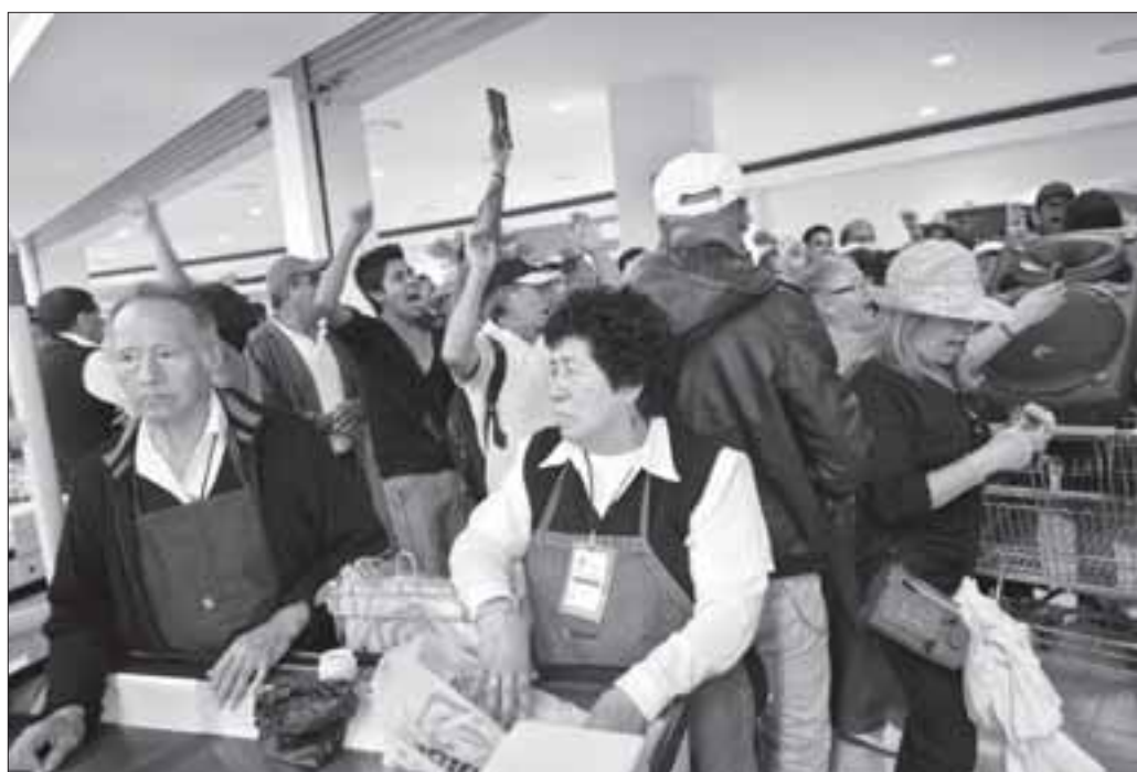
Aktivister, der protesterer mod valgsvindelen, har blandt andet aktioneret mod supermarkedskæden Soriana. Supermarkedskæden skal have leveret gavekort, som partiet PRI har uddelt som betaling for folks stemme på Enrique Peña Nieto.