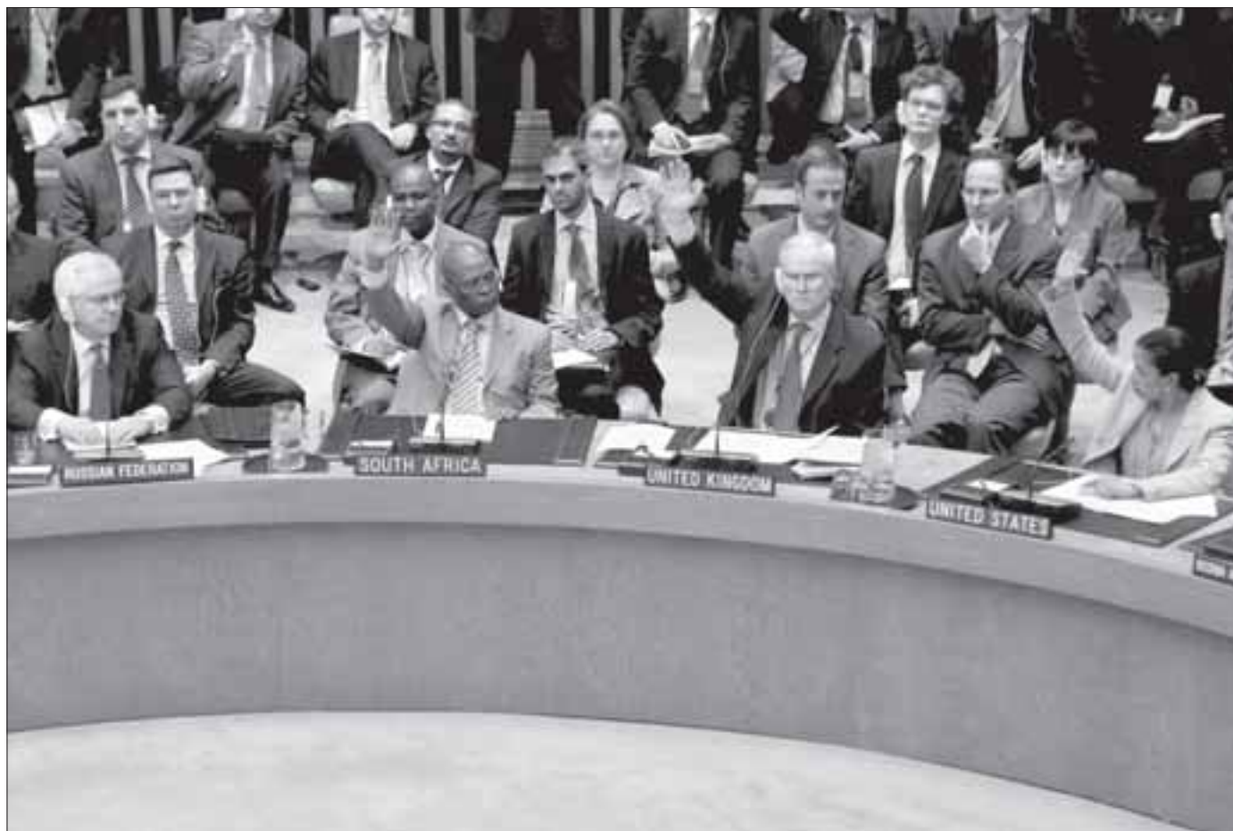
Torsdag samler ambassadørerne i FN's Sikkerhedsråd sig for at diskutere fremtiden for de 300 FN-observatører i Libyen. Her foto fra en afstemning i rådet om en flyveforbudszone over Libyen sidste år.